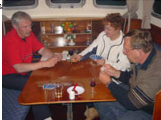
Doerak LX 800 AK