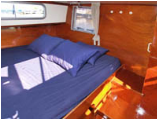
Doerak LX 800 Salon 2 pers.bed