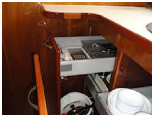
Doerak LX 800 Salon