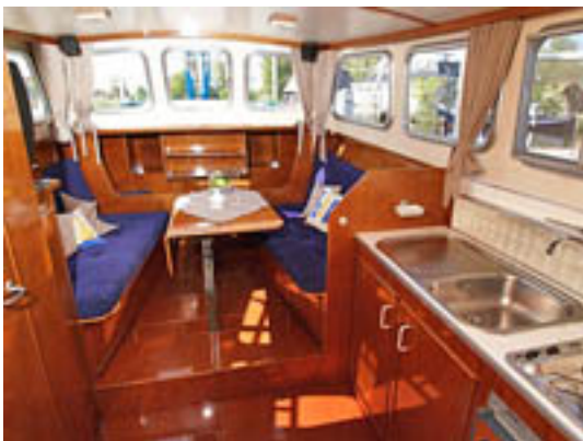
Doerak LX 800 AK voorkajuit