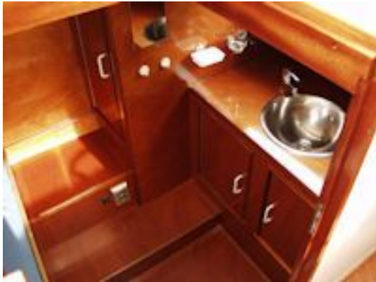
Doerak LX 901 OK Doerak LX901 OK Doerak LX901 OK